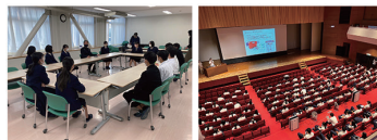
セクシャルマイノリティについて出張授業