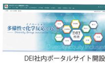
DEI社内ポータルサイト開設