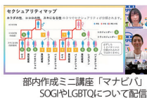
部内作成ミニ講座「マナビバ」 SOGIやLGBTQについて配信