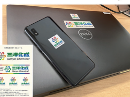
アライステッカー