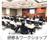
研修&ワークショップ