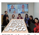
DEIアライネットワーク