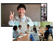
かずえちゃんのサロン「かず部屋」を 国内事業所やオンラインで開催