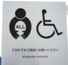
だれでもトイレを 複数事業所に設置